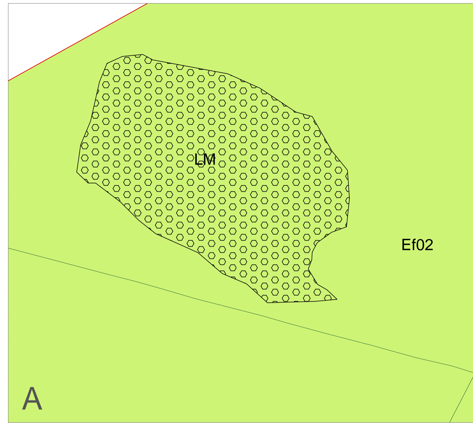
LM - speciale limitazione Lac Couvert

N.B. Gli stralci A) e B), indicati nel soprastante quadro d'insieme e rappresentati nella tavola grafica, si riferiscono a due aree esterne alle parti di territorio antropizzato.